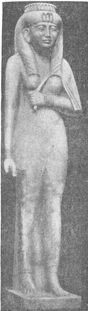
Рис. 4. Царица Амениритис. Известняк. Каир.

XXV дин. обычай у мужчин носить парики колоколособразной формы с пробором в середине. Убедительным тому примером является безусловно относящаяся к этому времени голова, приводимая Мерреем по аналогии с головой Ранофера из музея в Каире 1 . Заимствуется, по утверждению Биссинга 2 , из искусства Нового царства