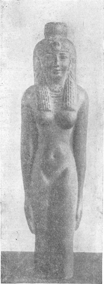
Рис. 1. Статуя царицы. Гранит. Гос. музей изобразительных искусств им. Пушкина.

В пользу предположения, что наша статуя представляет изображение царицы говорит и явная портретность статуи. Тонкая, играющая на лице улыбка, достигнутая несколько приподнятыми концами губ. Ни в новом царстве, ни в период XXVI династии мы не находим этой натуралистически сочной передачи формы, характеризующей наш памятник в целом.