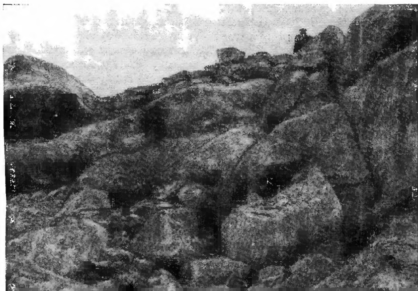
Рис. 3. Кладка на склоне горы

Надпись, обнаруженная в районе Бейук-даш, представляет значительный интерес для истории нашей Родины. Она является единственной латинской надписью на почве древней Кавказской Албании. Надпись у Бейук-даша, кроме того, привлекает